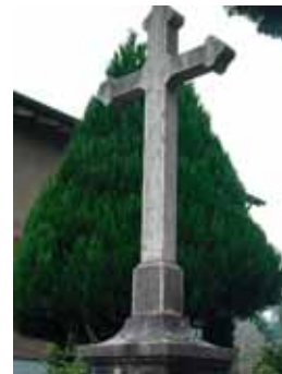
Das Sigmundskreuz an der Kaspar Koppstrasse erinnert an den Empfang des deutschen Kaisers Sigmund durch die Luzerner Staatsbehörden im Jahr 1417 in Ebikon