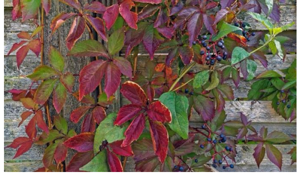
Wilder Wein / Gewöhnliche Jungfernebe