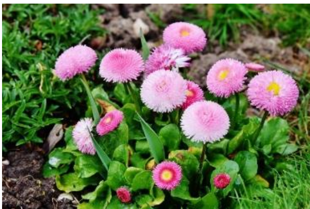
Tausendschön, gefüllte Gänseblümchen