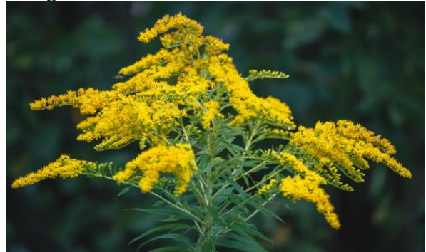
Amerikanische Goldrute/Kanadische Goldrute

Die Blüten dieser Pflanzen sind für gewisse Wildbienen ebenfalls attraktiv, jedoch werden sie als invasive Neophyten klassifiziert.